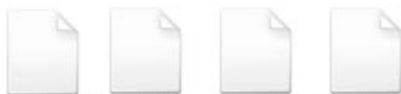
Feuille7 Feuille8 Feuille9 Feuille10