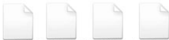
Feuille11 Feuille12 Feuille13 Feuille14